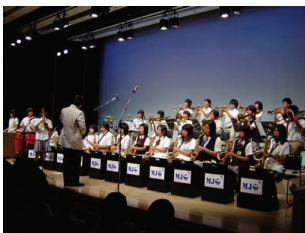
西宮市立西宮浜中学校 (MJO)