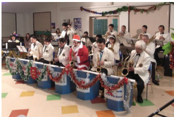
古野電気軽音楽部