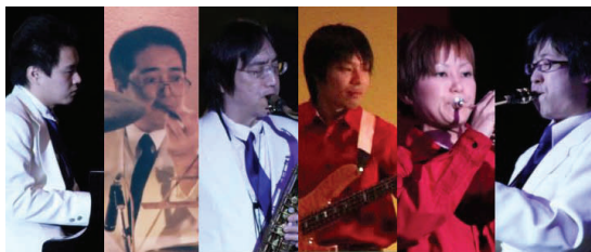
プチ ウエスト ウィンズ